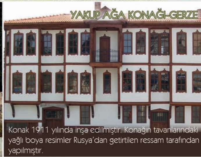
YAKUP AĞA KONAĞI-GERZE

Akgöl, 1200 m yüksekliktedir. Kışın buz tutar ve üzerinde yürünebilir bir hale gelir. Alabalık olan göde izne tabi olarak olta ile avlanmaya müsade edilmekte olup, saz türünde ve değişik sucul bitkilerin arasında bu eşsiz doğa güzelliğini sandal sefası eşliğinde gezebilirsiniz.