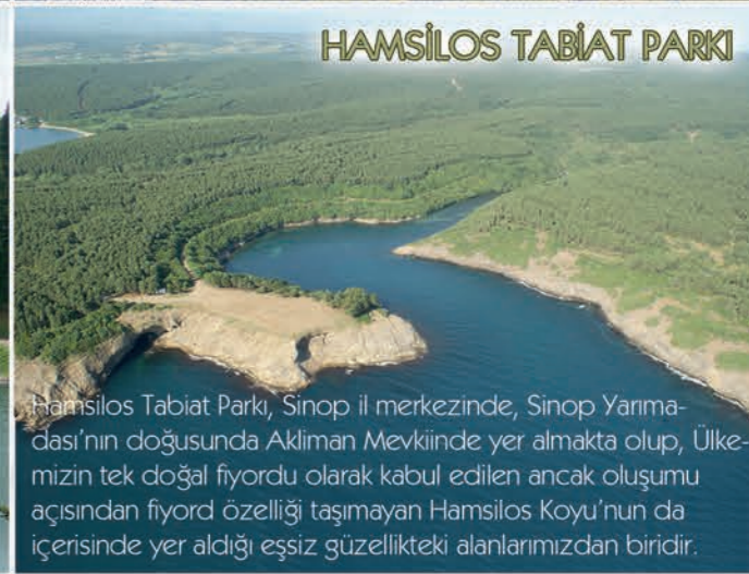
HAMSILOS TABİAT PARKI

Hamsilos Tabiat Parkı, Sinop il merkezinde, Sinop Yarımadası'nın doğusunda Akliman Mevkiinde yer almakta olup, Ülkemizin tek doğal fiyordur olarak kabul edilen ancak oluşumu açısından fiyord özelliği taşımayan Hamsilos Koyu'nun da içerisinde yer aldığı eşsiz güzellikteki alanlarımızdan biridir.