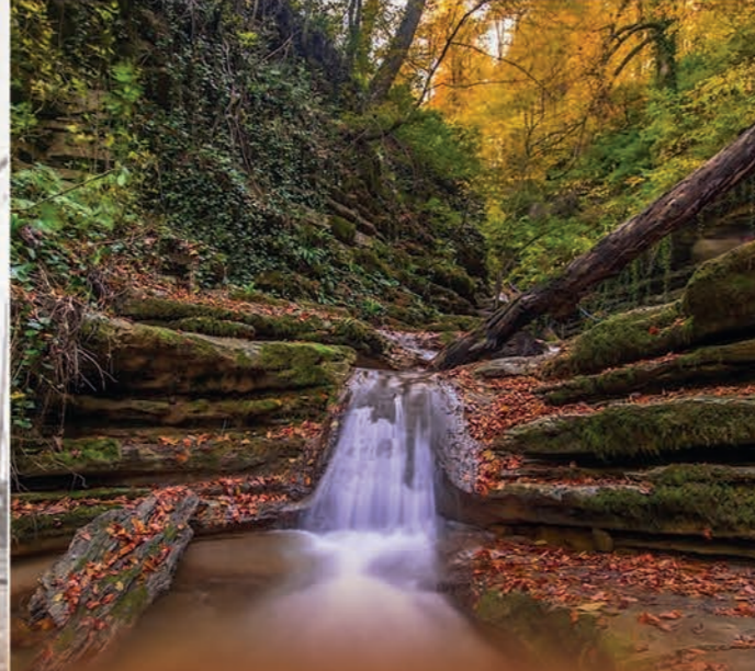
Erfelek Tatlıca Şelaleleri, kayın ormanlarından oluşan 2 km'lik bir vadi içinde sıralanmış 28 şelaleden oluşmaktadır. Bu özelliği ile dünyada bir eşi daha yoktur.