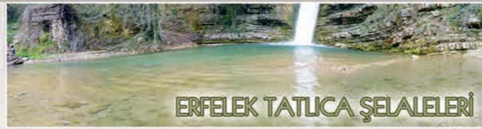
ERFELEK TATLIKA ŞELALELERİ

Sinop'ta yıl boyunca Karadenizin en lezzetli balıklarını ve yöresel yemekleri yemeniz mümkündür. 175 km'lik Sinop sahilinin 70 km sinde en temiz, en doğal ortamda rahatlıkla denize girebilirsiniz. Değişik çiçek, bitki ve kuşlarla yaban hayvanlarını barındıran Sarkum, inceburun, hamsilos, akliman bölgesinde trekking ve gezi yaparken, doğanın güzelliğine hayran kalacaksınız.